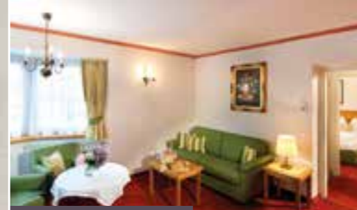
Juniorsuite für 2 – 4 Personen, ca. 35 – 40 m 2