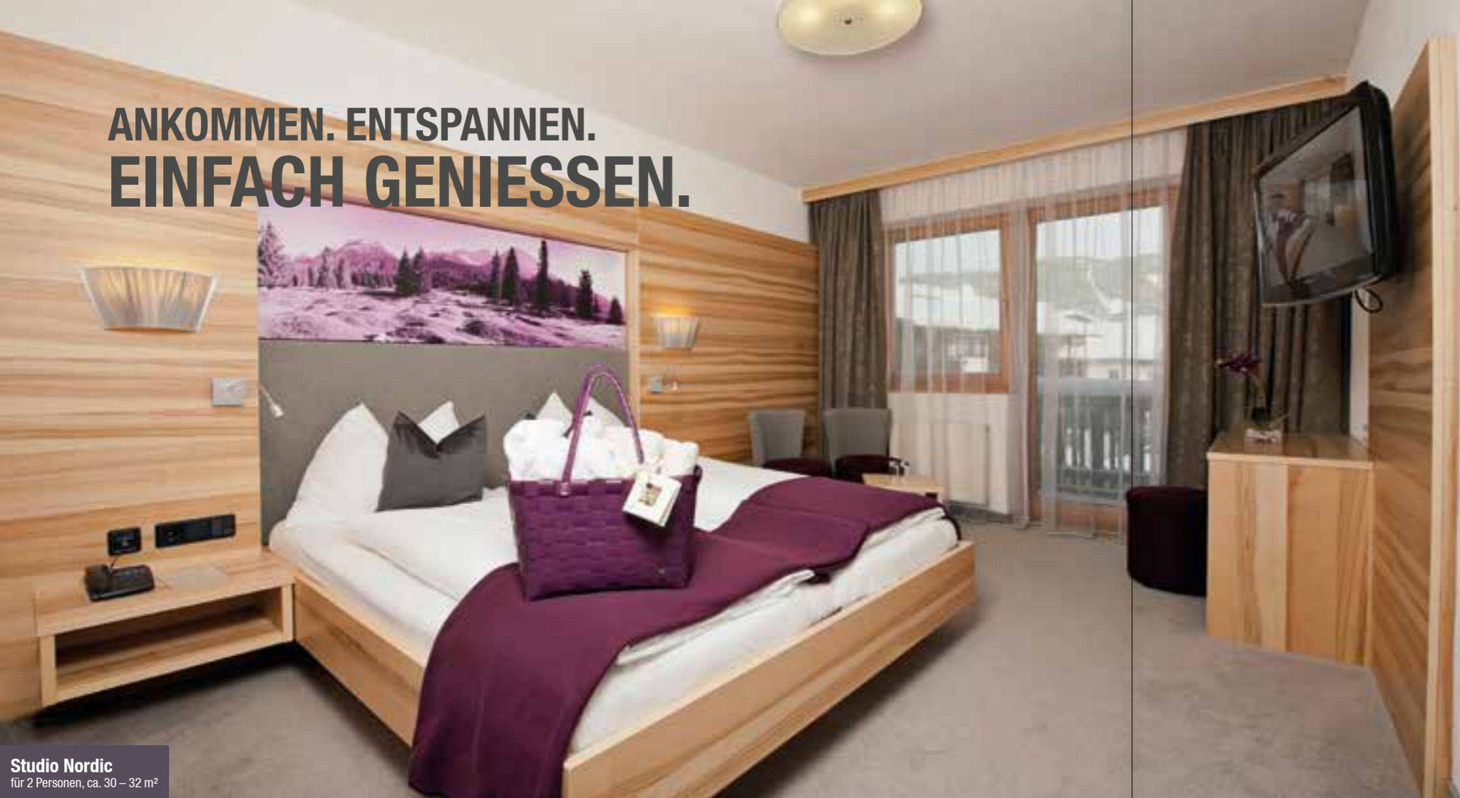
Studio Nordic für 2 Personen, ca. 30 – 32 m 2

ANKOMMEN. ENTSPANNEN. EINFACH GENIESSEN.