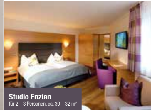
Studio Enzian für 2 – 3 Personen, ca. 30 – 32 m 2