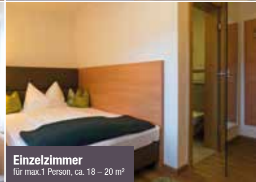
Einzelzimmer für max.1 Person, ca. 18 – 20 m 2