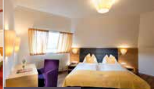
Juniorsuite Edelweiss für 2 – 4 Personen, ca. 35 – 40 m 2